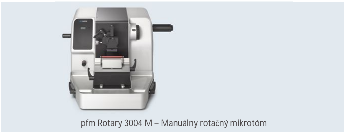
pfm Rotary 3004 M – Manuálny rotačný mikrotóm